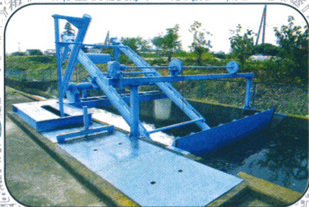
右岸 3 号自动堰